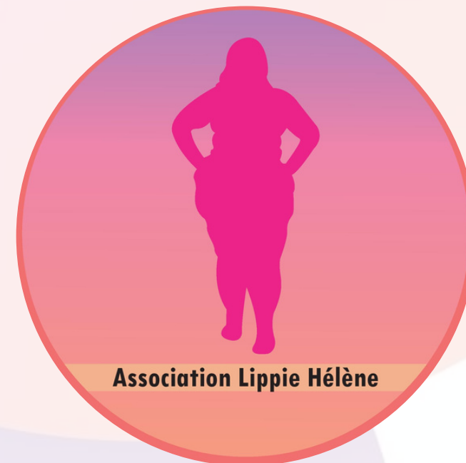
Association Lippie Hélène

LIPPIE HELENE EST UNE ASSOCIATION INDEPENDANTE LOI 1901